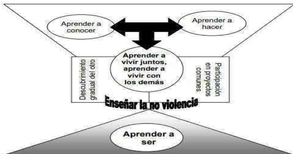
Figura.01. La gestión de conflictos en el aula