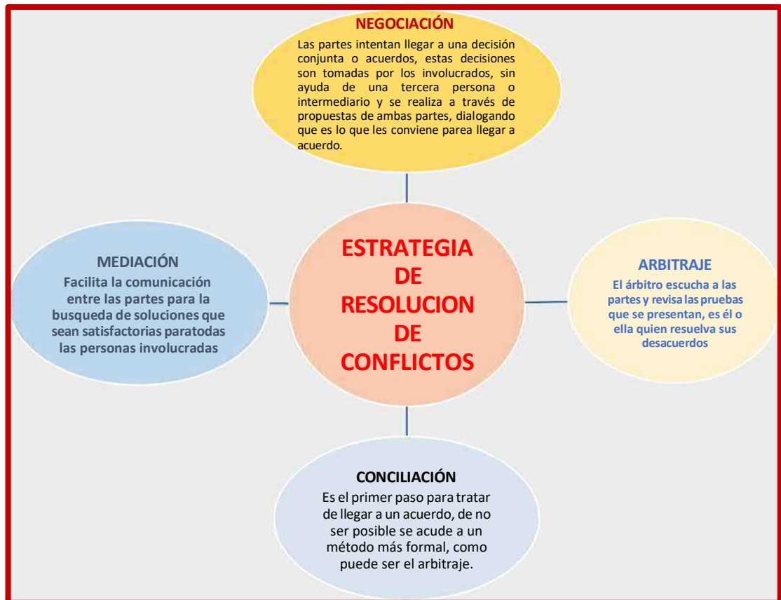
Figura 03. Selección de estrategias de la resolución de conflictos